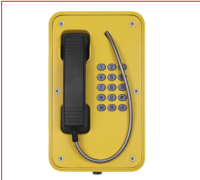
Teléfono resistente a la intemperie